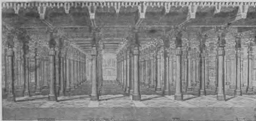
Персеполь. Стоколонный зал. Реконструкция Шипье.