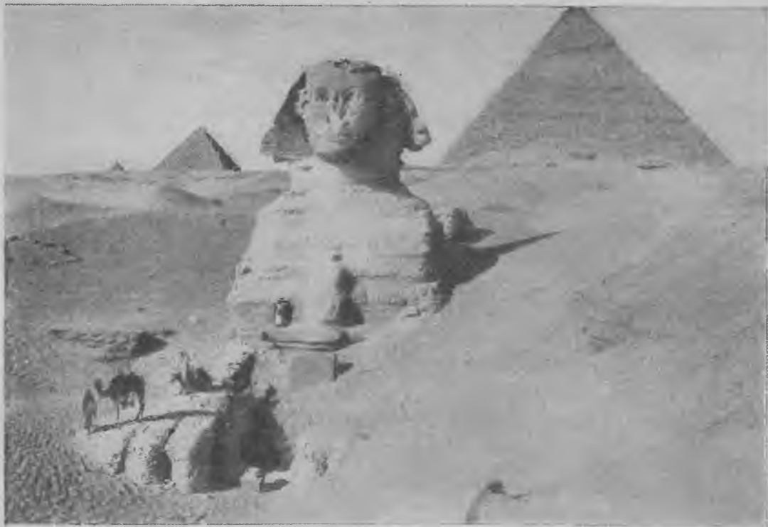
Сфинкс у пирамиды Хеопса.