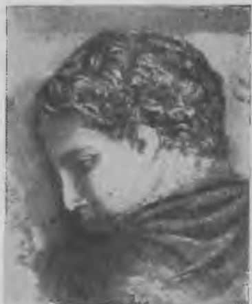
Головы воинов. Деталь рельефа на „Саркофиге Александра“.