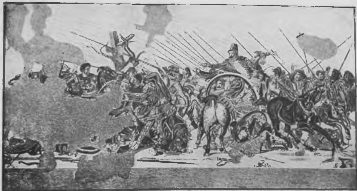
Битва Александра Македонского и Дария. Мозаика из Помпей.