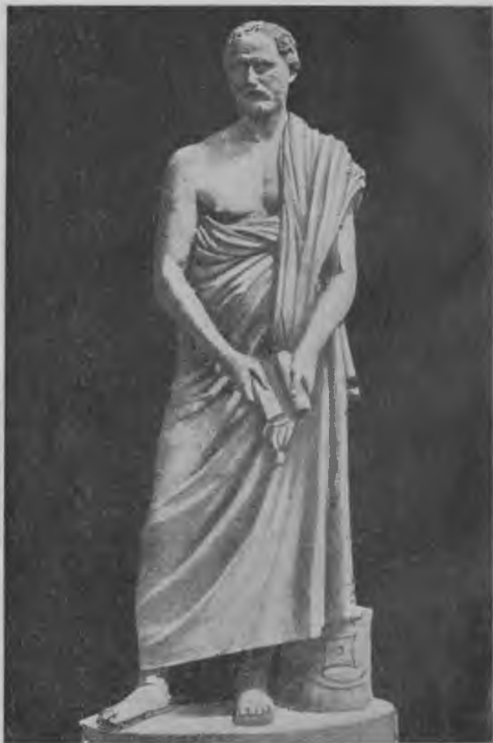
Демосфен, вождь антимакедонской партии в Афинах.