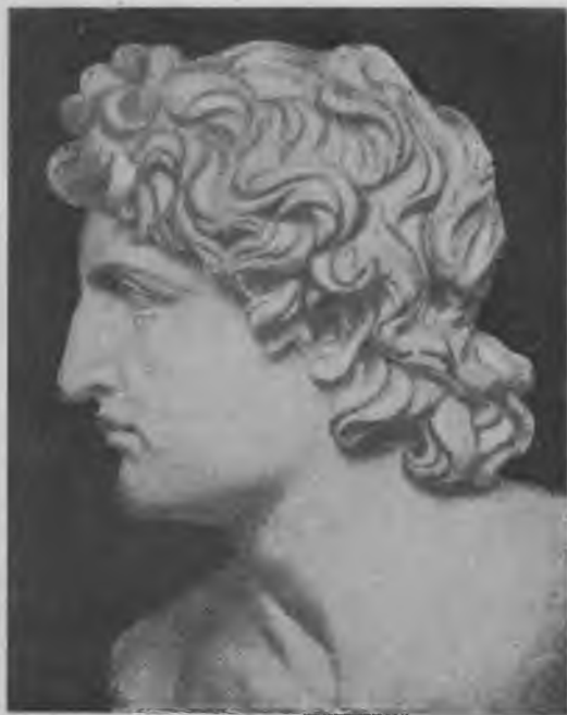
Голова статуи Александра.