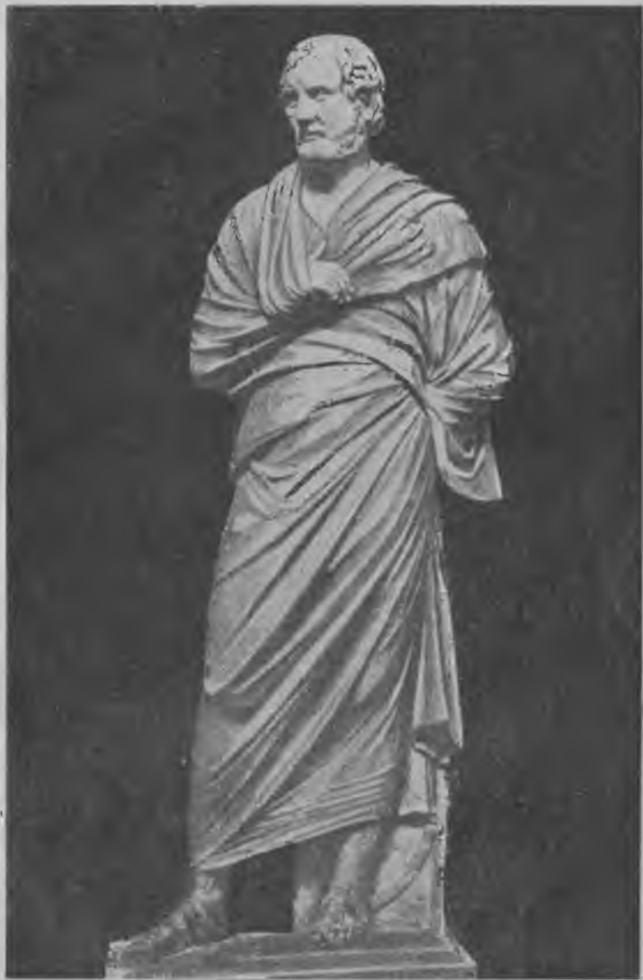
Эхин, вожь македонской партии в Афинах.