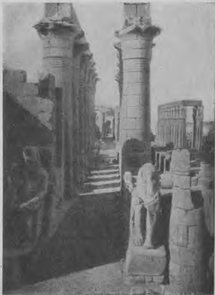
Колоннада египетского храма в Луксоре.