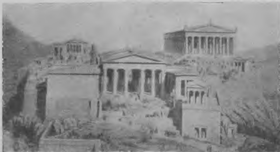
Афинский акрополь. Реконструкция.