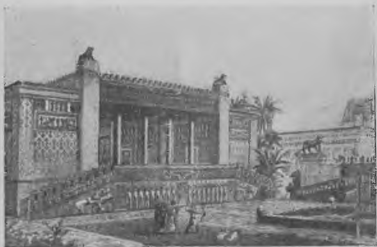
Дворец Дария. Реконструкция Шипье.