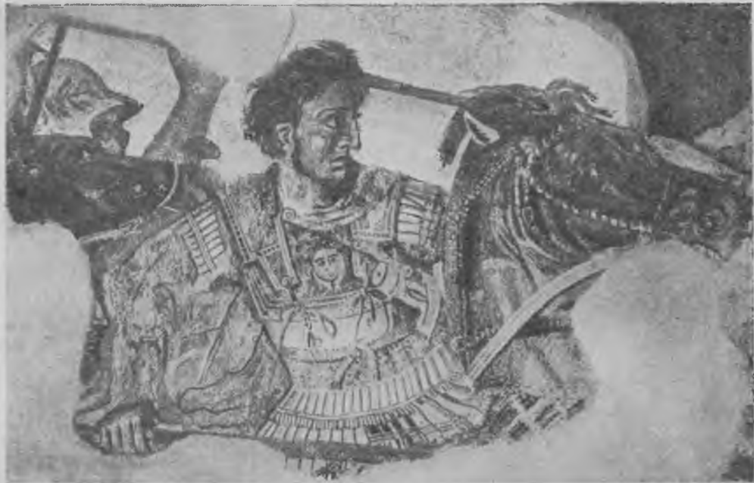
Александр Македонский. Деталь мозаики из Помпей.