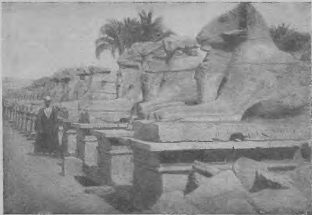
Аллея сфинксов с головою барана в Карнаке.