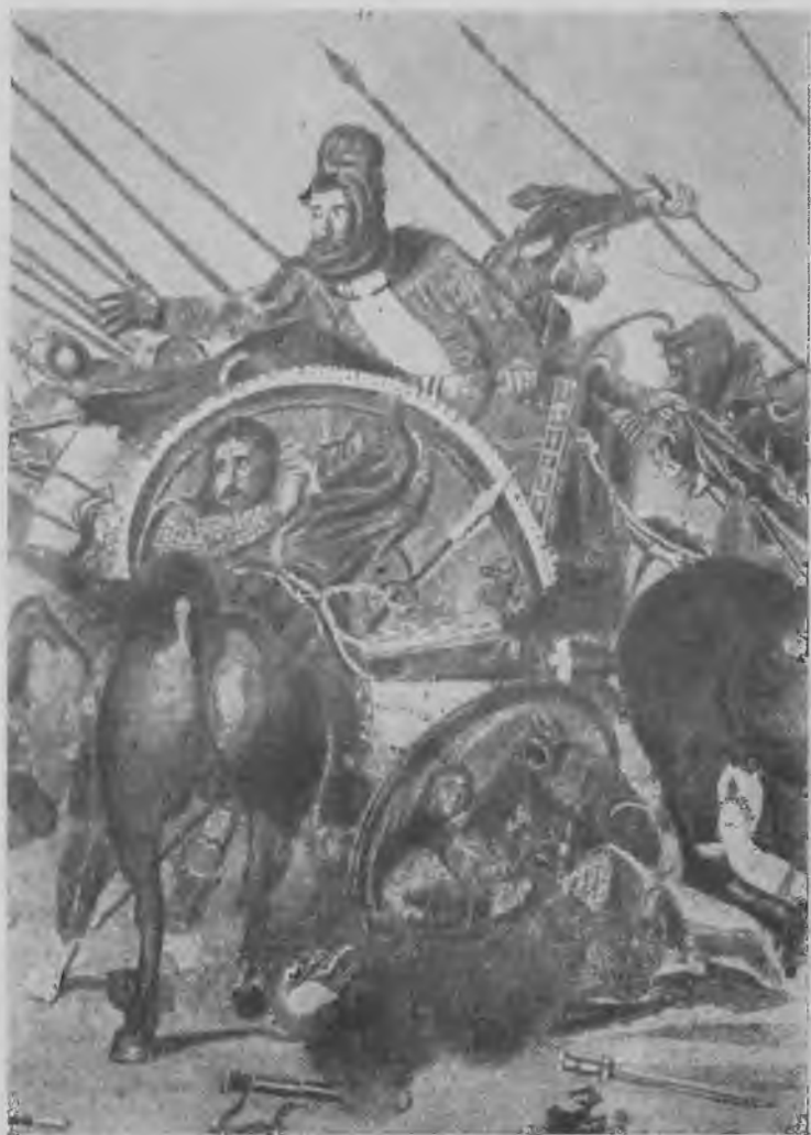
Дарий. Деталь мозаики из Помпей.