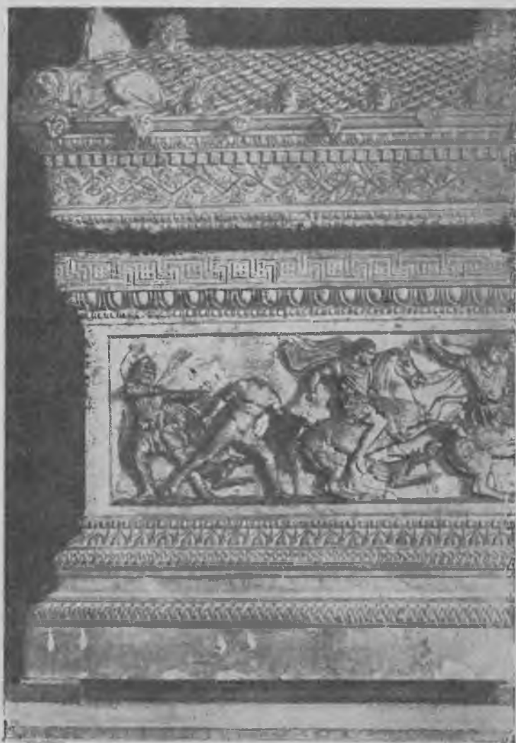
„Саркофаг Александра“. Деталь.