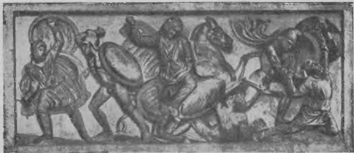
Сцена битвы греков с персами. Рельеф на „Саркофаге Александра“.