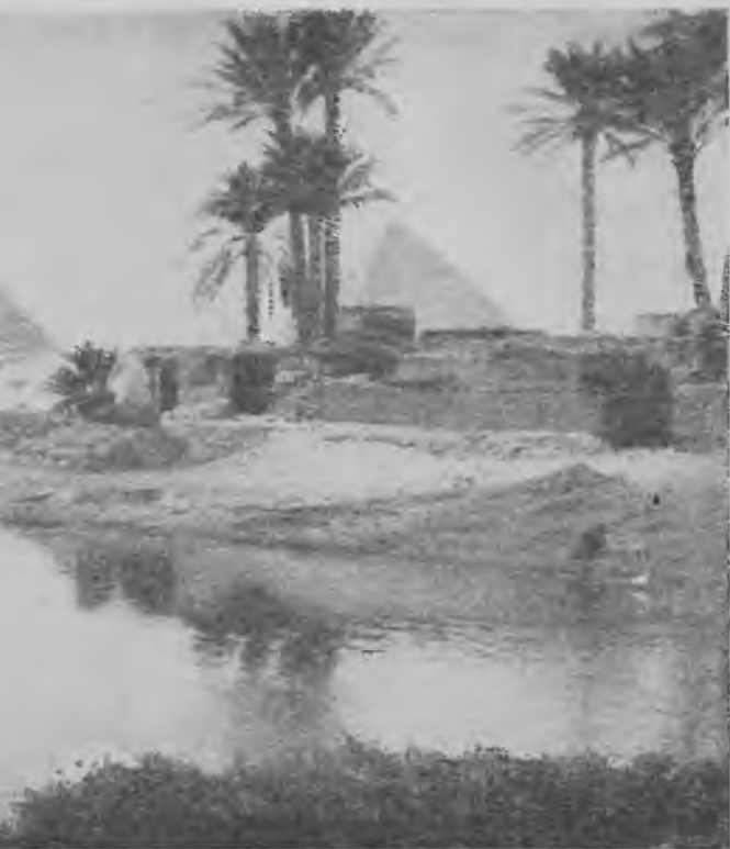
Нил и пирамиды.