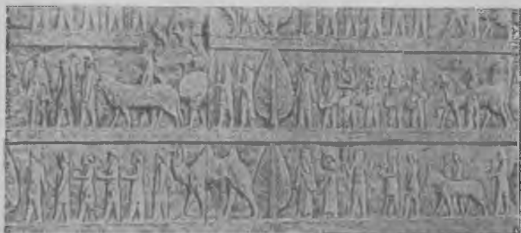
Дворец Ксеркса в Персеполе. Рельефные украшения лестницы.