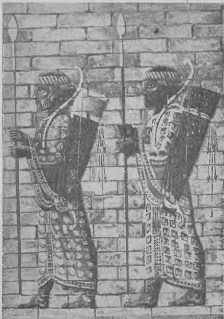
Персидские гвардейцы. Фриз из цветных изразцов из дворца Артахсеркса II в Сузах.