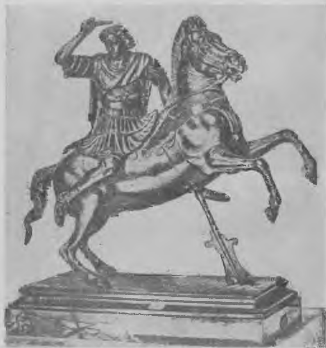
Статуя Александра из Геркуланума. Бронза.