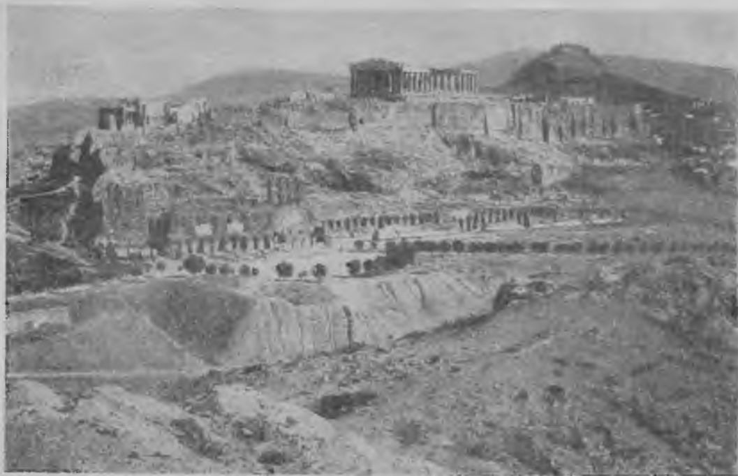
Афины. Общий вид.