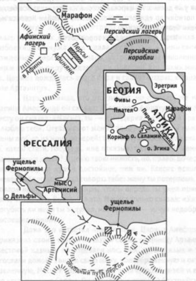
Фермопилы (конец августа 480 г. до н.э.)