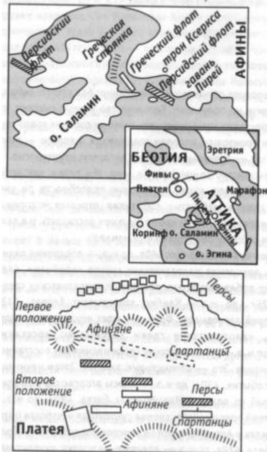
Платея (август 479 г. до н.э.)