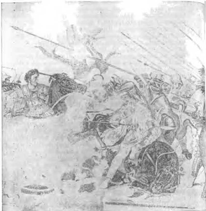
Битва при Иссе. Копия картина Филоксена Эретрийского. Мозаика па Помпей. Неаполь, Национальный музей.

тался пробиться к Дарию III. Вокруг него битва была особенно ожесточенной. Многие приближенные персидского царя погибли, коней, которыми была запряжена его колесница, израненных и исколотых копьями, невозможно было удержать на месте, и Дарий с большим трудом пересел на другую колесницу. Сам Александр получил рану в бедро.