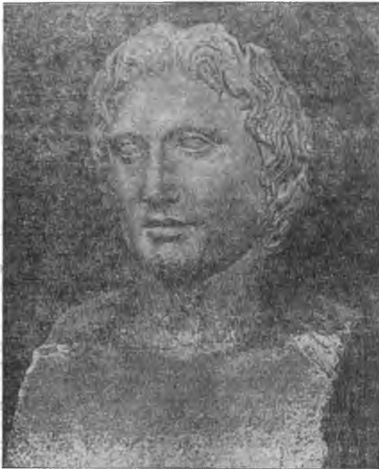
Копия портрета Александра Македонского работы Лисиппа (вторая половина IV в. до н. э.). Париж, Лувр.

ренных процессов, имевших место в социально-экономической, политической и культурной жизни народов Греции и Ближнего Востока в предшествующий период. И все же сбрасывать со счета македонского царя нельзя.