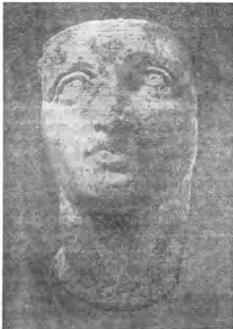
Портрет Александра Македонского на погребения Филиппа II в Вергине Слоновая кость. Салоники (Греция), Археологический музей.

а за него, Александра. Пиксодар согласился: такой зять его устраивал гораздо больше. Но этот проект натолкнулся на ожесточенное сопротивление Филиппа II. Явившись к Александру в сопровождении Филоты, сына Пармениона, одного из близких, как считалось, друзей царевича, он осыпал сына упреками и запретил ему жениться. Филипп говорил, что Александр, желая стать зятем варвара-карийца, раба персидского царя, показывает себя низким человеком, недостойным тех благ, которые у него имеются. В речах Филиппа проглядывала, конечно, откровенная угроза лишить Александра прав на престол. Насколько опасным считал для себя Филипп неожиданный для него проект женитьбы Александра, об этом свидетельствует тот факт, что он разогнал все окружение царевича, а его ближайших друзей — Гарпала, Неарха, Эригия, Лаомедонта, Птолемея — выслал из Македонии [Плу-